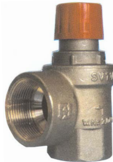
SVH 30x1 1/4"