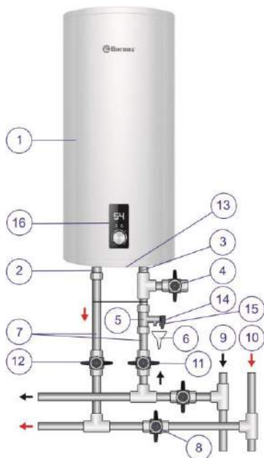
Рисунок 1. Схема подключения ЭВН к водопроводу

Рисунок 1: 1 – ЭВН, 2 – патрубок горячей воды, 3 – патрубок холодной воды, 4 – сливной вентиль, 5 – предохранительный клапан, 6 – дренаж в канализацию, 7 – подводка, 8 – перекрыть вентиль при эксплуатации ЭВН, 9 – магистраль холодной воды, 10 – магистраль горячей воды, 11 – запорный вентиль холодной воды, 12 – запорный вентиль горячей воды, 13 – защитная крышка, 14 – выпускная труба предохранительного клапана, 15 – ручка для открывания предохранительного клапана, 16 – панель управления.